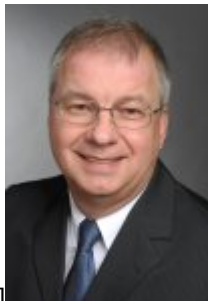
[caption id="attachment_607" align="alignnone" width="104"] Autor: Heinz Bialas, Senior Sales Manager, Spinner GmbH, 80335 München[/caption]

Bedingt durch Industrie 4.0 und die daraus resultierende Vernetzung von Maschinen und Anlagen fallen heute in der Industrie enorme Datenmengen an. Dadurch steigen die Anforderungen an Datenübertragungsraten und -qualität. Eine Möglichkeit, Daten zu übertragen, sind Schleifringe, allerdings können sie schon nach kurzem Betrieb ausfallen. Drehübertrager erlauben auch bei sehr hohen Drehzahlen Übertragungsraten von bis zu 1 Gbit/s bei Ethernet-basierten Bussystemen.