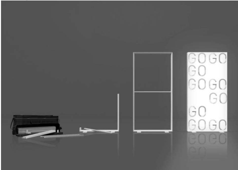
Einfacher Aufbau.

darf. ABS zeichnet sich vor allem durch sein geringes Gewicht und die hohe Festigkeit aus, die den Produkten geringen Verschleiß und lange Lebensdauer ermöglichen. Das Leichtgewicht aus Kunststoff bietet in puncto Transport einen großen Gewichtsvorteil gegenüber Alurahmensystemen. In Verbindung mit einer ausgeklügelten Transporttasche passt das komplette System in nahezu jeden Pkw und bietet sich somit auch für mobile Einsätze an. Das intelligente und intuitive Stecksystem ermöglicht den schnellen und einfachen Aufbau innerhalb von wenigen Minuten – und das ohne Werkzeuge.